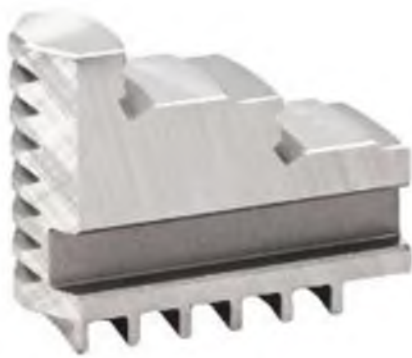
Кулачки мягкие цельные